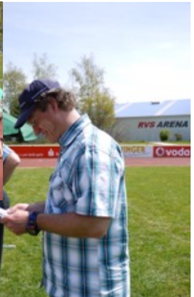
Impressionen von der Bahneröffnung