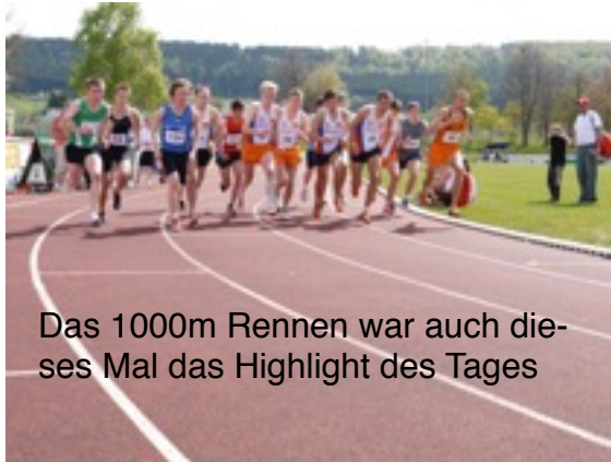
Das 1000m Rennen war auch dieses Mal das Highlight des Tages

nie die Chance, den Anschluss wahren zu können. Mit dem glänzenden neuen Stadionrekord von 2:26.74 Minuten demonstrierte er schon zu Saisonbeginn tolle Form und lieferte damit wohl die beste Leistung des Tages ab. Im Verfolgerfeld sicherte sich der